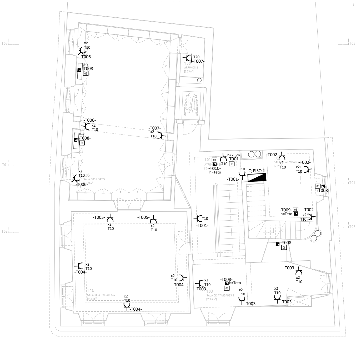
PROPOSTA planta - piso 1