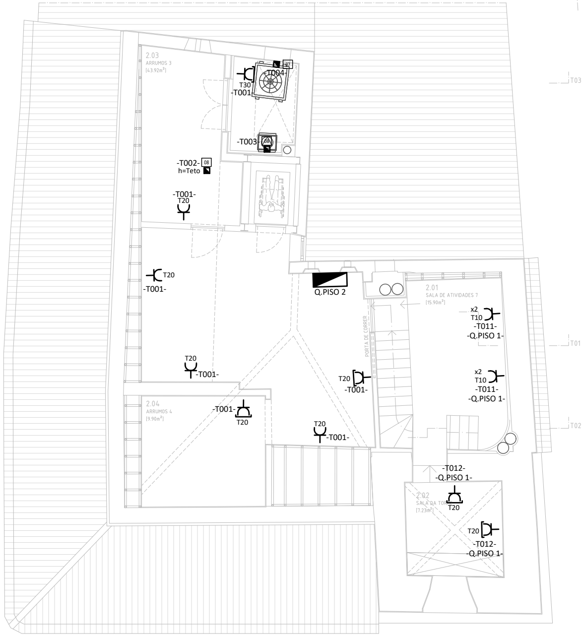
PROPOSTA planta - piso 2

NOTAS : Sempre que o traçado seja realizado no teto falso, a ligação vertical às tomadas embebidas será feita por canalização embebida entre o teto falso e a tomada. As tomadas serão instaladas a uma altura mínima de 30cm do pavimento, excepto quando indicado.